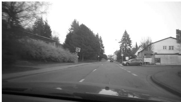
Rechtsabbiegung Ormesheimer Berg.