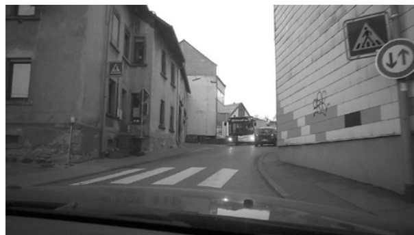
Fahrbahnverengung Ortsmitte Bliesransbach.