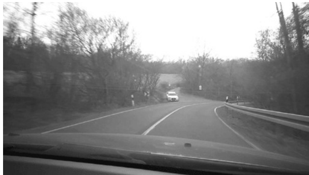
Nicht einsehbare Rechtskurve Fechinger Berg.

Radsportverein Edelweiß 1905 Bliesransbach e.V.