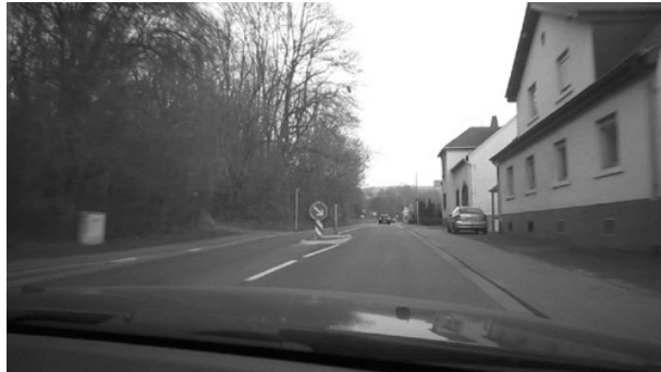
Fahrbahnteiler Ortsausgang Fechingen.

Radsportverein Edelweiß 1905 Bliesransbach e.V.