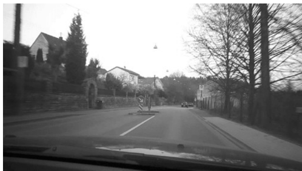
Fahrbahnteiler 2 Ortseingang Eschringen.