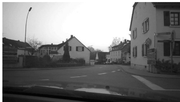
Kreuzungsbereich Ortsdurchfahrt Bliesmengen, gerade aus.