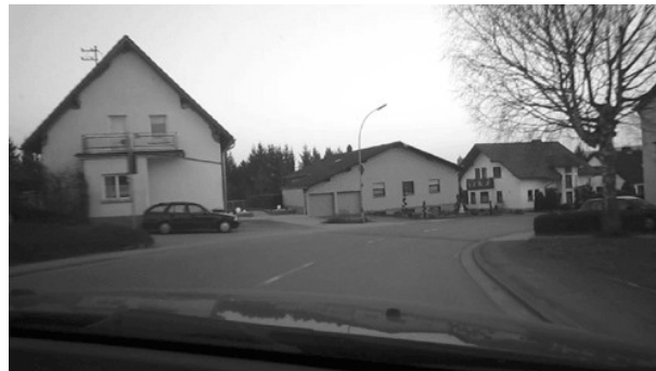
Nicht einsehbare Rechtskurve Ortseinfahrt Bliesmengen.

Radsportverein Edelweiß 1905 Bliesransbach e.V.