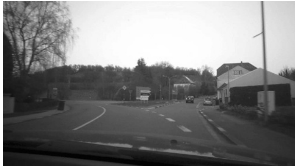
Rechtsabbiegung Ortseingang Ormesheim.

Radsportverein Edelweiß 1905 Bliesransbach e.V.