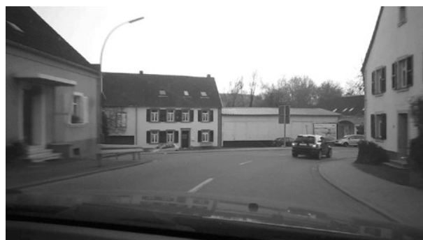
Nicht einsehbare 90 Grad Rechtskurve Bliesmengen.