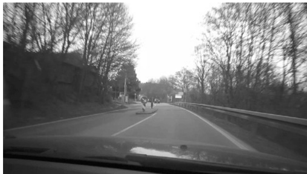
Fahrbahnteiler 1 Ortseingang Eschringen.