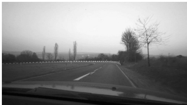
90 Grad Linkskurve Abfahrt Fechinger Berg.