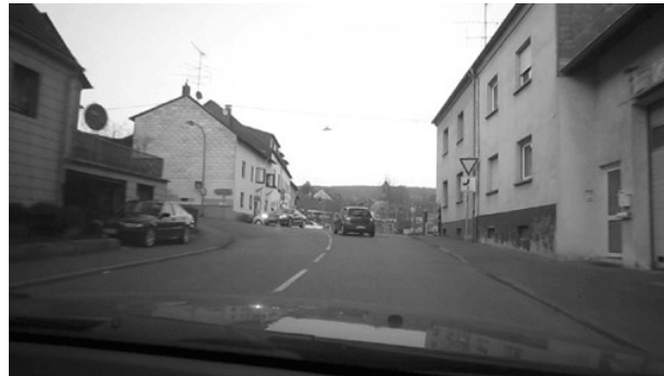
Kreuzungsbereich Ortsmitte Bliesransbach, links ab.

Radsportverein Edelweiß 1905 Bliesransbach e.V.