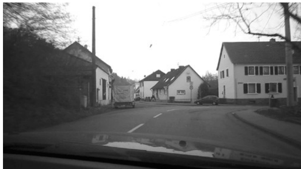
Ortseinfahrt Fechinger 90 Grad Rechtskurve.