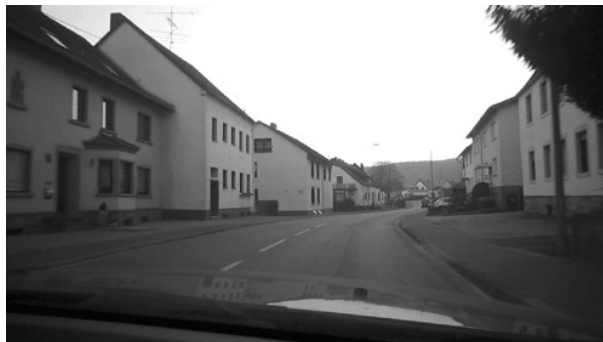
Start- Ziel Bereich Fechinger Straße.

Die gesamte Rennstrecke ist während der Veranstaltung nur in Einbahnrichtung und zwar in Rennrichtung befahrbar. Während der Vorbeifahrt des Rennfeldes wird die Zufahrt zur Rennstrecke kurzzeitig gesperrt. Den Beginn der Sperrung zeigt ein Polizeifahrzeug mit roter Flagge an. Nach der Durchfahrt der Rennfahrer wird die Rennstrecke wieder in Einbahnrichtung für den Fahrzeugverkehr freigegeben. Dies wird durch ein Polizeifahrzeug mit grüner Flagge angezeigt. Die Zufahrtsstraßen zur Rennstrecke werden durch Ordner und/oder Polizeibeamte abgesichert.