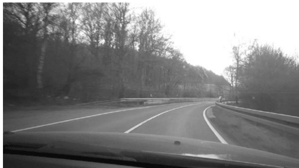
Nicht einsehbare Rechtskurve Abfahrt Ormesheimer Berg.